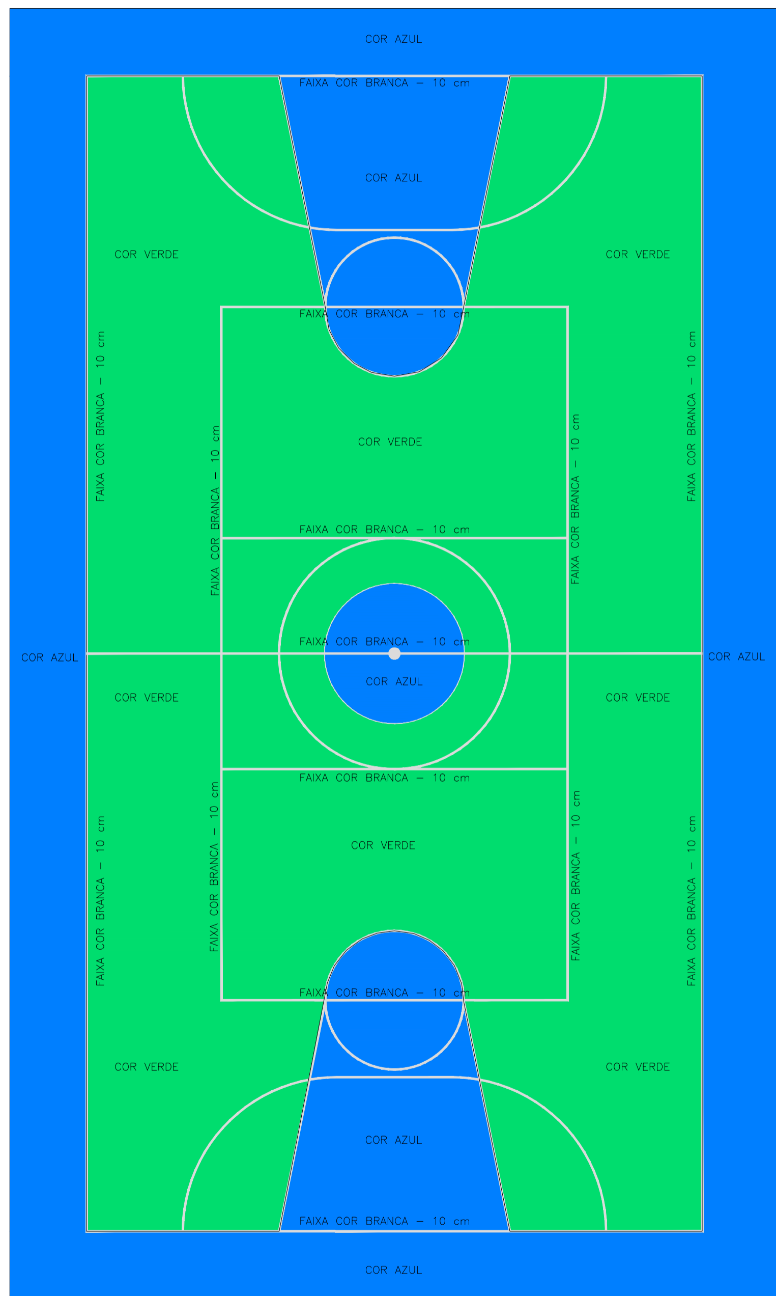
1 Pintura Quadra 1:100